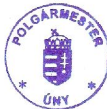
Pósfai József polgármester

Mellékletek: - 1. táblázat, - 2. táblázat