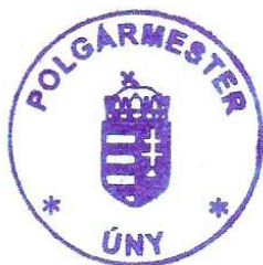
Pósfai József polgármester

Úny Község Önkormányzata Képviselő-testületének .../2016. (.....) önkormányzati rendelete az önkormányzat 2015. évi költségvetéséről szóló 1/2015. (II.6.) önkormányzati rendelet módosításáról